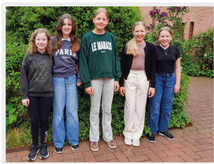
Unsere neuen Konfirmandinnen