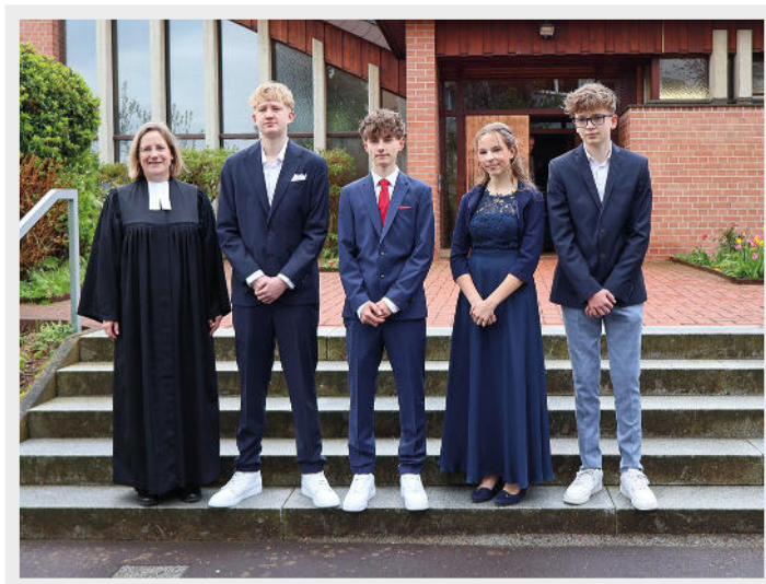
Die 2026 Konfirmierten